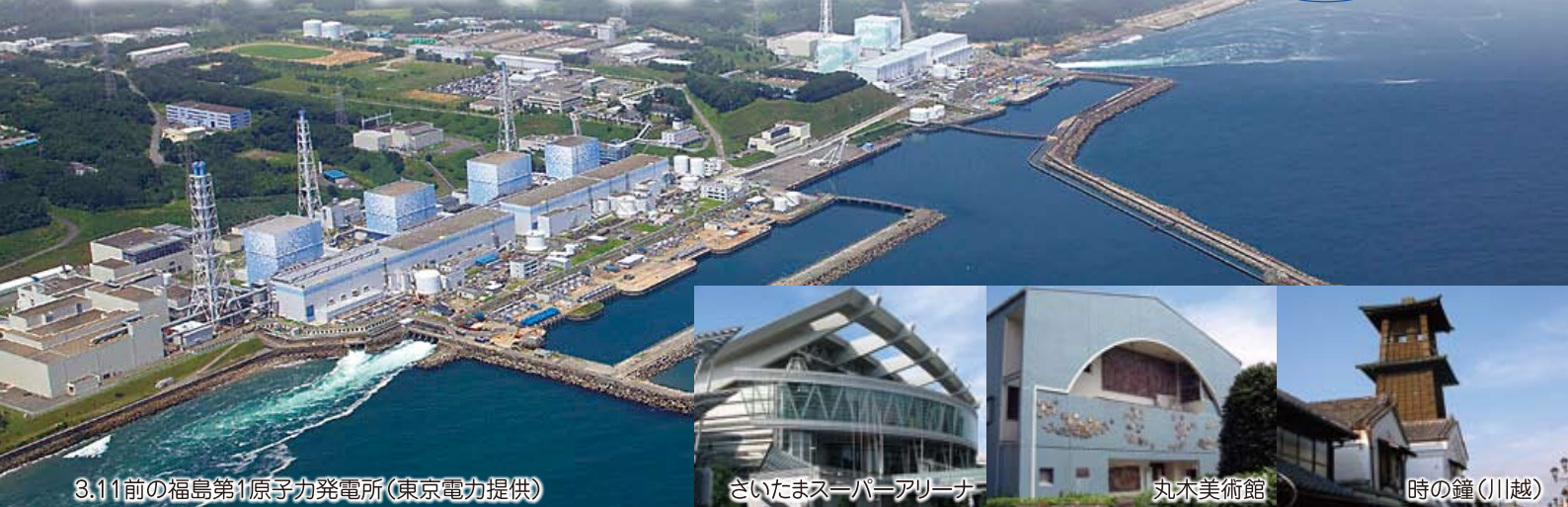
3.11前の福島第1原子力発電所